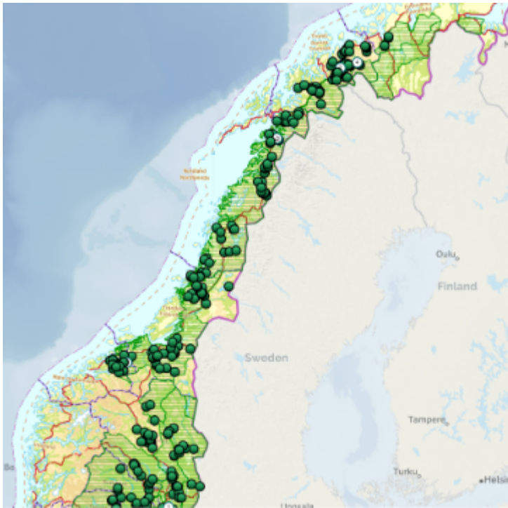
Figur 4. Fordelingen av etablerte ulverevir vinteren 2023-2024. Mørkere grønn angir ulvesona, og samtlige ynglinger av ulv er registrert innenfor ulvesona.